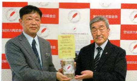
▲義援金の協力(宮城県社会福祉協議会)