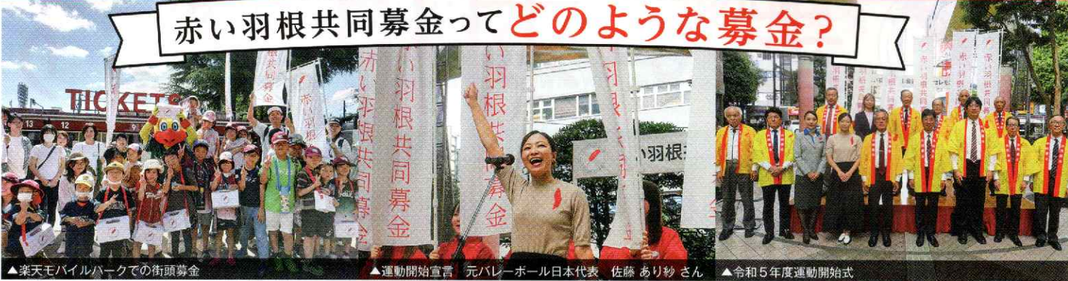
▲楽天モバイルパークでの街頭募金