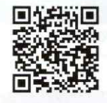
宮城県共同募金会HP