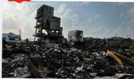
▲被災地の様子(石川県輪島市)

共同募金の一部を積み立て、被災地で立ち上げられた災害ボランティアセンターの運営費に役立てられます。