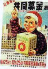
▲昭和22年度運動ポスター

赤い羽根共同募金運動は、共同募金会が行う民間の募金活動です。昭和22年（1947年）に「国民たすけあい運動」として始めて以来、長年にわたって皆さまのご支援とご協力に支えられ、今年78回目を迎えました。社会が大きく変化の中で、近年は生活に困難を抱えたり、居場所を失い孤立するなど福祉課題が顕在化しています。課題解決に向けた活動を支援する共同募金の必要性は高まっています。