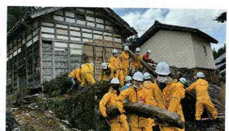
▲学生のボランティア活動(石川県穴水町)